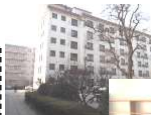
写真(イメージ) 左：宿舎外観 下：部屋

北京大学関係者の方のご自宅にグループで訪問して一緒に食事をします。過去に外国人留学生を受け入れたことのある家庭がほとんどです。