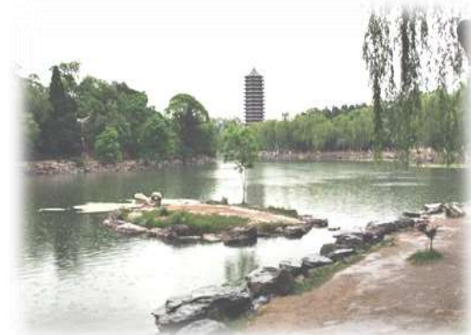
北京大学キャンパス内 未名湖